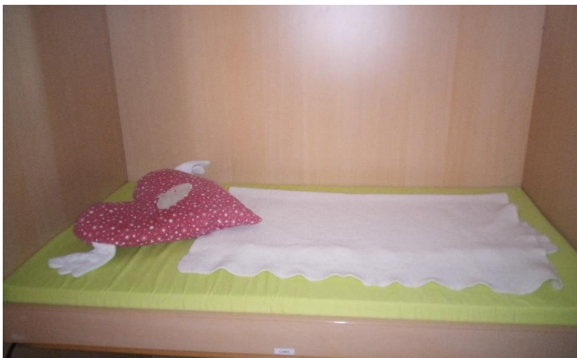
Schlafräum der Wolkengruppe

Basis hierfür bildet das individuelle Aufnahmegespräch, in welchem ein Austausch über das Schlafverhalten Ihres Kindes stattfindet. Die Eingewöhnung ist für einen gesunden Schlaf von großer Wichtigkeit. Sie sollte ohne zeitlichen Druck und bedürfnisorientiert ablaufen. Ein regelmäßiger Informationsaustausch findet täglich in kurzen Tür- und Angelgesprächen statt. In einem ausführlichen Reflexionsgespräch, welches nach der Eingewöhnungszeit zwischen Eltern und päd. Fachkräften stattfindet, gibt es noch einmal die Möglichkeit das aktuelle Schlafverhalten genauer zu beleuchten.