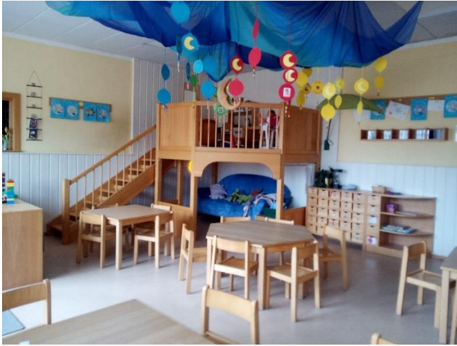
Rollenspielbereich der Mondgruppe

Frei nach Goethe zitiert, sollen Kinder sowohl Wurzeln als auch Flügel erhalten, um sich gesund und altersgerecht entwickeln zu können. Wir als Bildungseinrichtung verstehen die Gestaltung von Bildungsprozessen genau so, wie sie in dem Zitat vorkommen. Wir schaffen den pädagogischen Boden, in dem die Fähigkeiten wurzeln, und die Freiräume, die die Kinder zum Wachsen beflügeln.